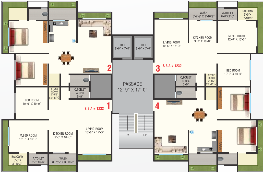
TYPICAL FLOOR PLAN (1st To 13th)