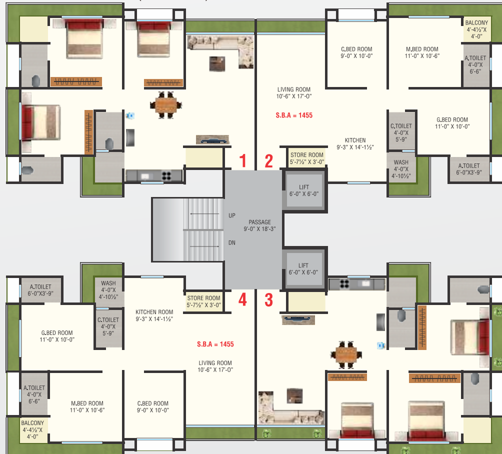
TYPICAL FLOOR PLAN (1st To 13th)